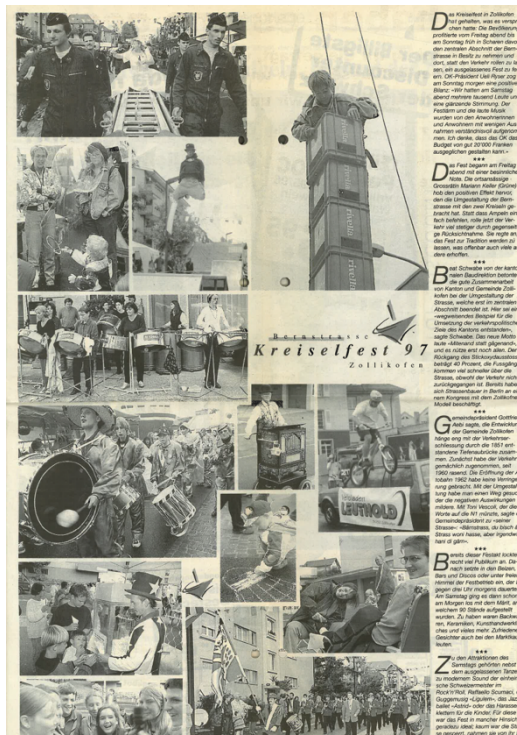
Impressionen vom Kreisel Festival 1997